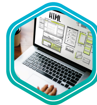
Form Layout เค้าโครงแบบฟอร์ม