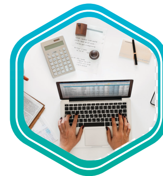
Form Elements องค์ประกอบของแบบฟอร์ม

ตัวสร้างมี 3 ส่วนเพื่อช่วยให้คุณปรับแต่งแบบฟอร์มของคุณได้อย่างเต็มที่