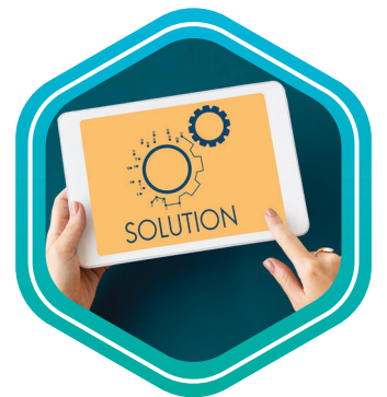
Form Settings การตั้งค่าแบบฟอร์ม